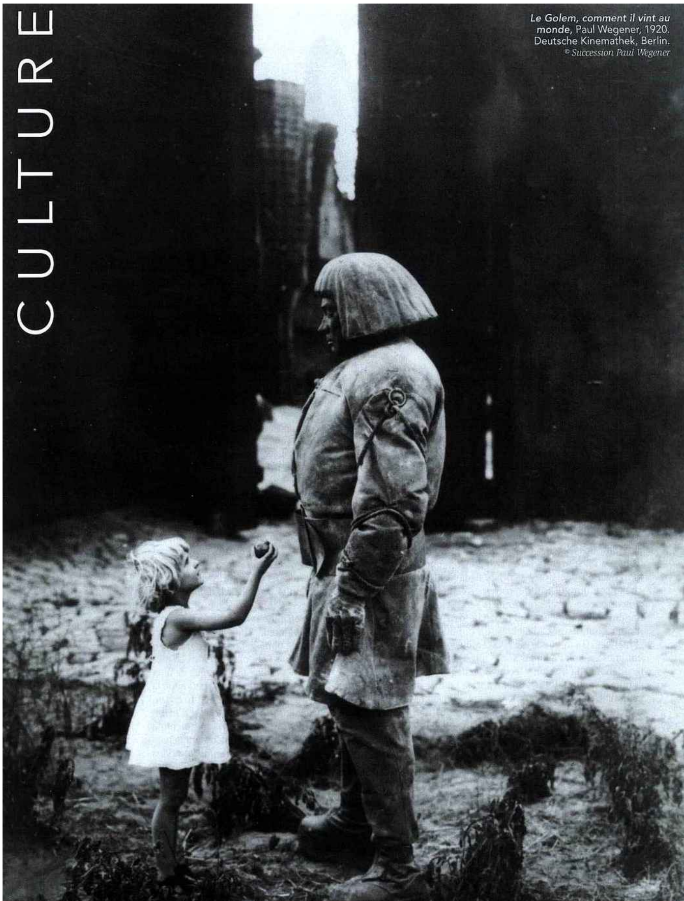
Le Golem, comment il vint au monde, Paul Wegener, 1920. Deutsche Kinemathek, Berlin. © Succession Paul Wegener