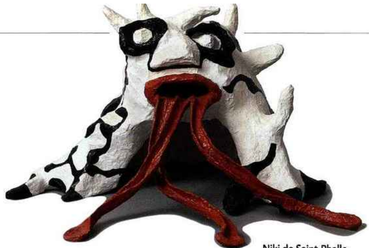
Niki de Saint-Phalle, maquette pour Le Golem , 1972, Jérusalem, musée d'Israël. © 2017 Niki Charitable Art Foundation / Adagp, Paris

La légende du Golem n'a cessé de nourrir l'imaginaire et l'art, des traités de mystique juive du Moyen Âge jusqu'aux jeux vidéo d'aujourd'hui. Le musée d'Art et d'Histoire du judaïsme les retrace.