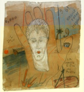
Robert Desnos La comptabilité du poète (circa 1925)