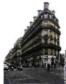
► A voir au Pavillon de l'Arsenal.

Au Pavillon de l'Arsenal, dans une exposition passionnante et touffue, des architectes nous expliquent comment les « îlots haussmanniens », ces blocs d'immeubles modulables qui donnent au vieux Paris son allure caractéristique, avaient quelque chose de révolutionnaire : lumineux, relativement économes en énergie, denses mais pas vécus comme oppressants... Bien sûr, les contemporains d'Haussmann n'étaient peut-être pas tous de cet avis (du moins pas ceux dont les logements ont été rasés) mais aujourd'hui, le constat est là, avec force maquettes, schémas et études détaillées. L'ensemble n'étant pas très accessible au premier abord, on vous conseille les visites guidées